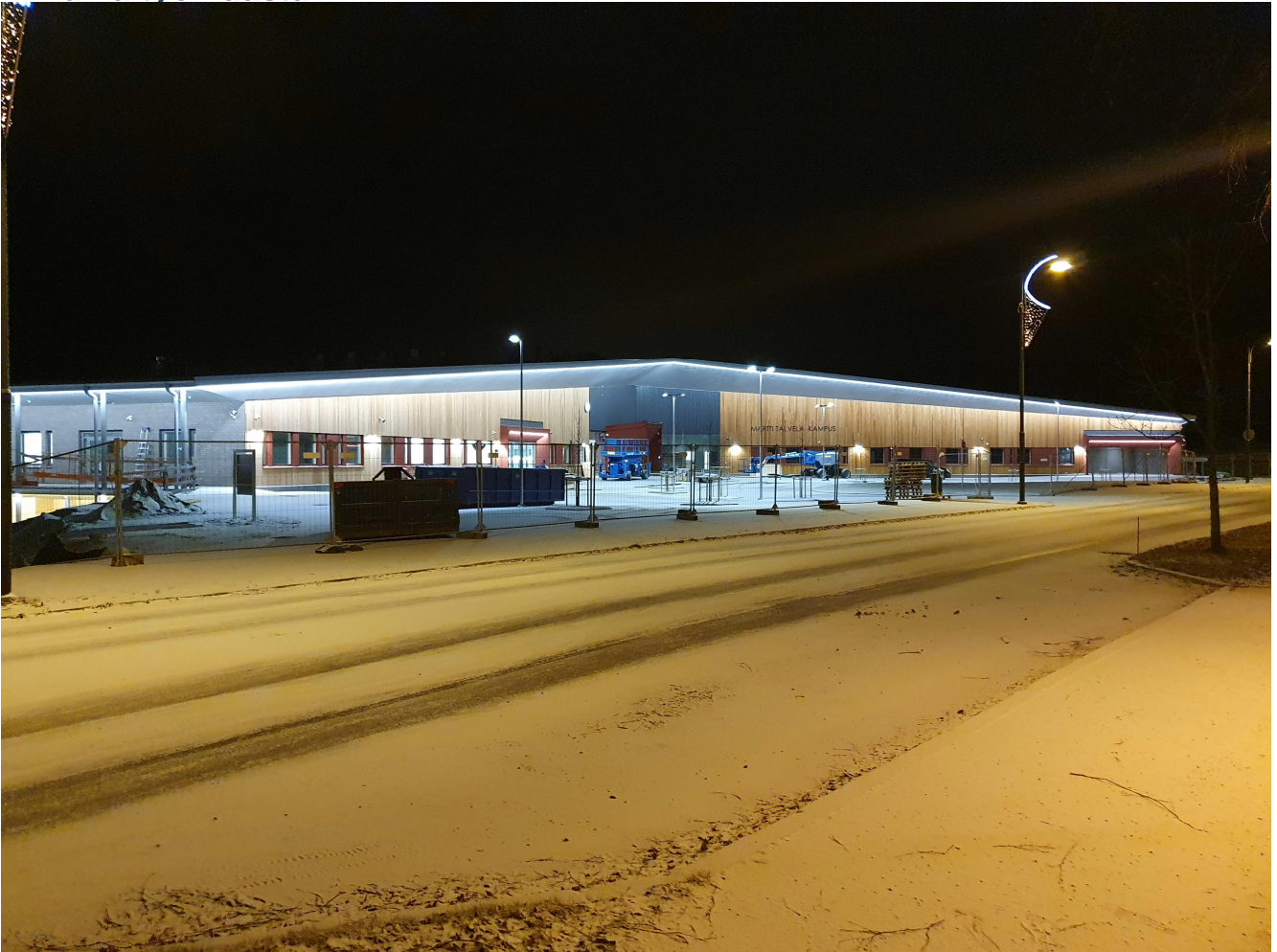
Kampuksesta kuva aamulla