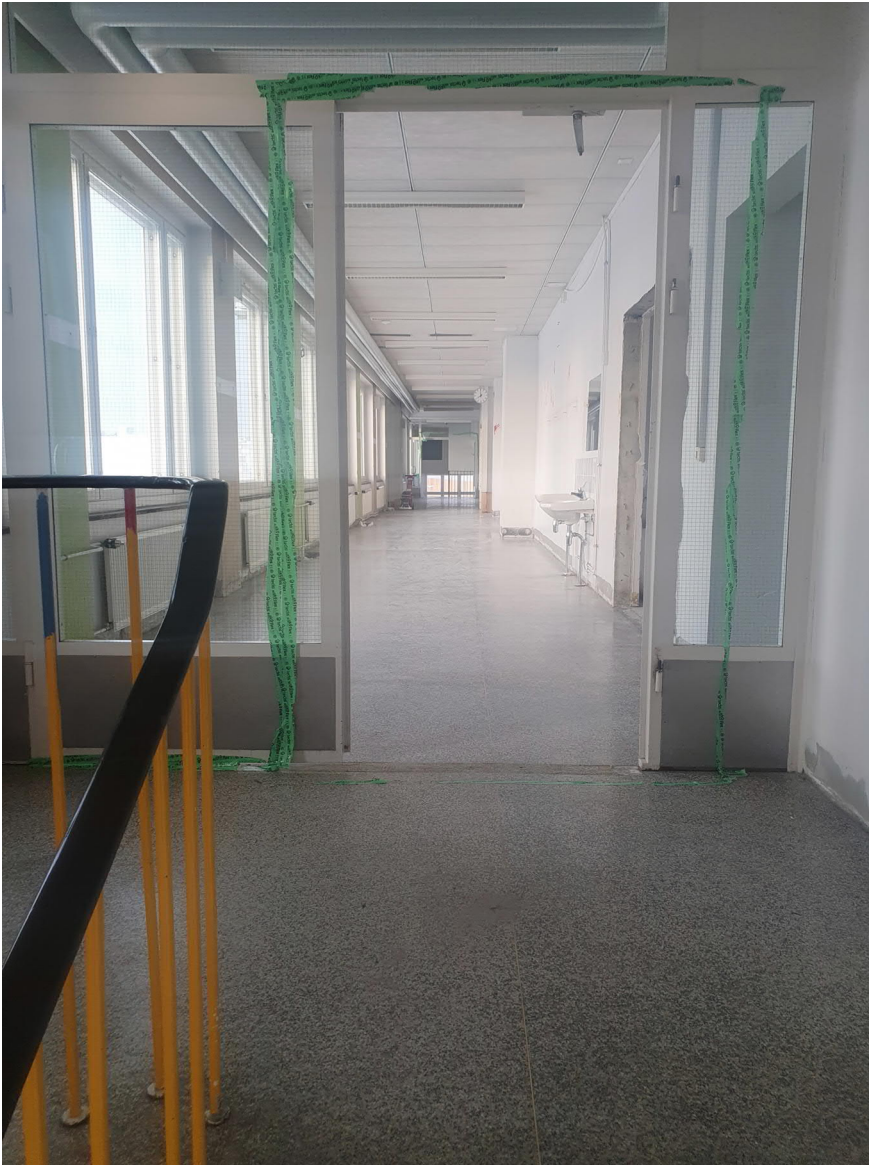
Purettavan koulun sisäpuolelta kuvia