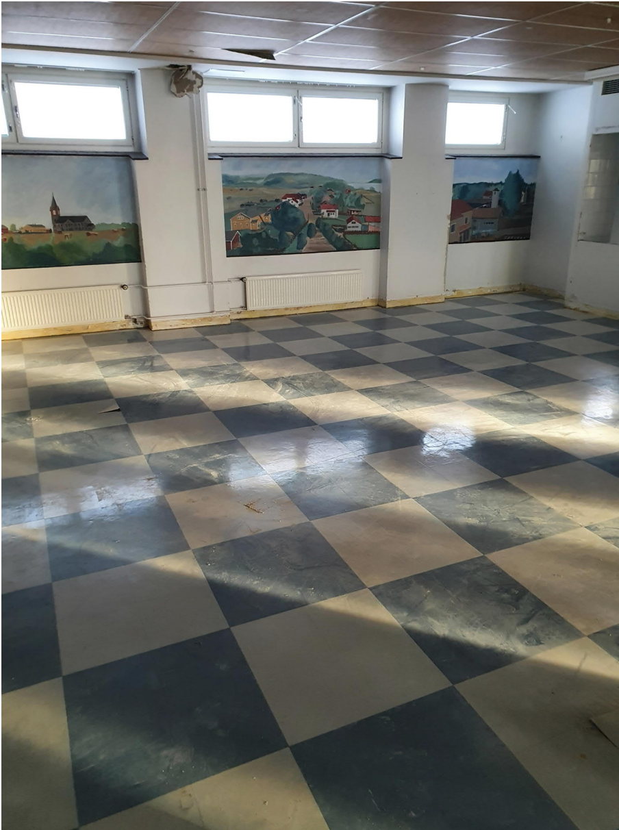
Purettavan koulun sisäpuolelta kuvia