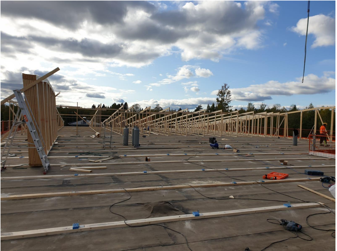
A-lohkon kattotuoli asennukset käynnissä.